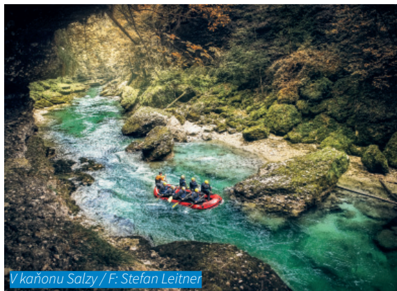
V kaňonu Salzy

POZOR! Stav je měřen ve Wildalpenu. Před soutěskou přitéká do Salzy spousta dalších řek, a proto je tento stav čistě orientační a neměla by podle něj být posuzována splavnost celé řeky. Při pochybách se poradte s místními vodáky!